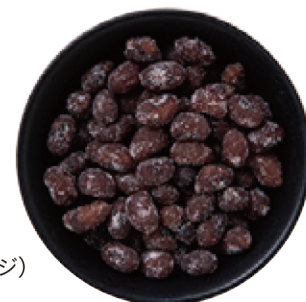
榮太樓總本舗の 「甘名納糖」